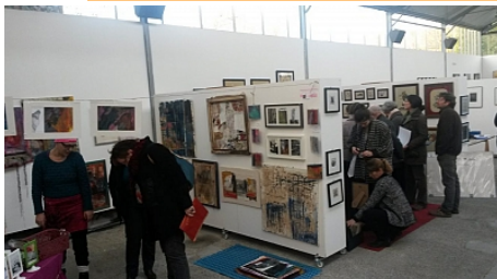
OT Saint Lô Agglo