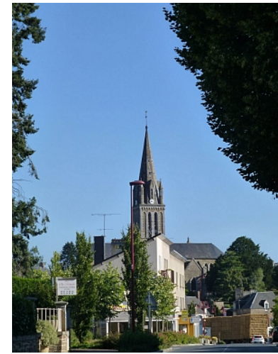
Saint Lo Agglo